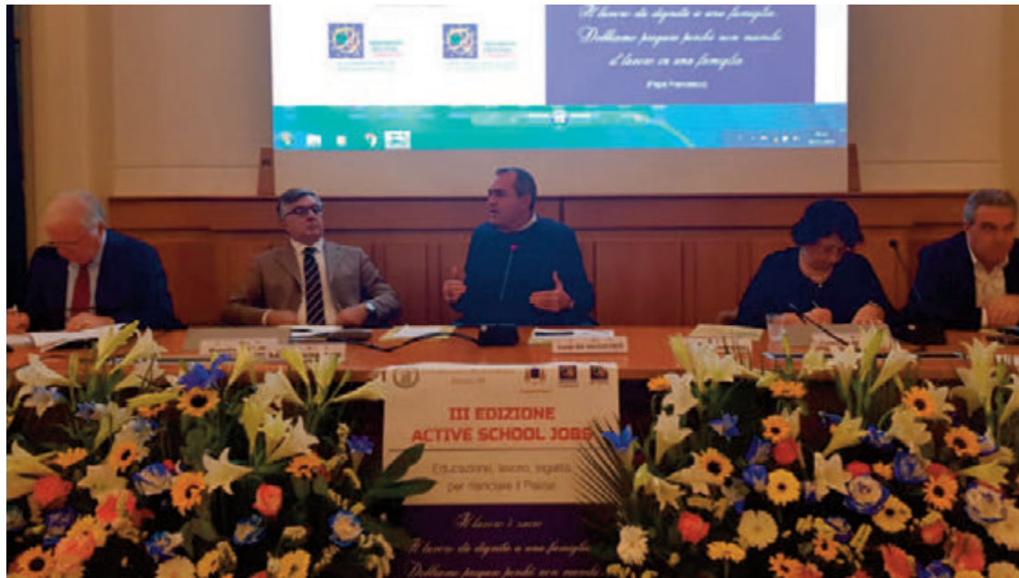
Un momento del convegno del Movimento cristiano lavoratori