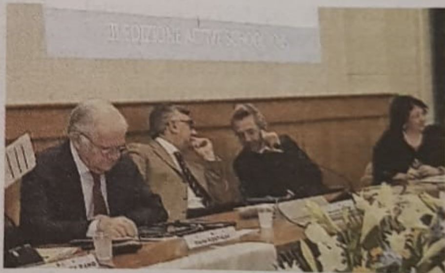
LE CONCLUSIONI Un momento del dibattito