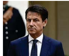
"Conte portaci la fattura", il 'caso Alpa' nel mirino delle Iene