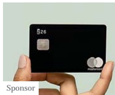
Sponsor Perché scegliere N26 rispetto alla Postepay (N26)