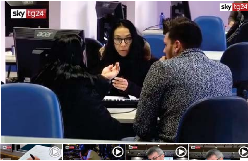
Reddito cittadinanza, una card per ogni... Incidenti Piazza Carlo, morta donna... Landini: con questa manovra Italia a... Cgil, Landini a Sky tg 9/2 in piazza...