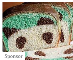
Sponsor VIDEO: 4 distruttori della digestione (evitare) (Corpo Perfetto)