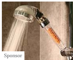
Sponsor Il soffione rivoluzionario batte i record di vendite (Hyper Tech)