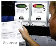
Quale fornitore luce e gas scegliere nel 2019? Scopri il più (www.comparaerisparmia.com)