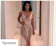
Kim Kardashian: il segreto delle sue forme (Glamour)