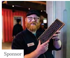
Chi possiede un PC dovrebbe subito controllare (The Review Experts)