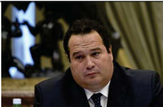
Claudio Durigon, sottosegretario al Lavoro e alle politiche sociali

Cronaca Politica Esteri Regioni e Province Video News Tg AdnKronos