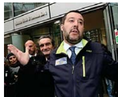
"Un lord...", Salvini contro il portavoce di Orlando