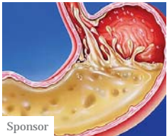
VIDEO: 4 distruttori della digestione (evitare) (Corpo Perfetto)