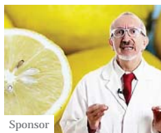
Sponsor Limone, anticancro e curativo? Ecco la verità dell'oncologo (veritasulcancro.it)