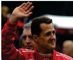
"Così vive oggi Schumacher"