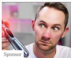
Sponsor Se hai un PC dovresti subito controllare questo (The Review Experts)