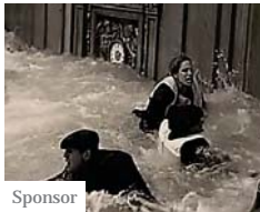
Foto mozzafiato del Titanic prima del naufragio