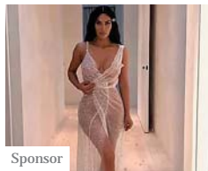
Sponsor Kim Kardashian: il segreto delle sue forme (Glamour)