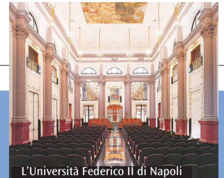
L'Università Federico II di Napoli